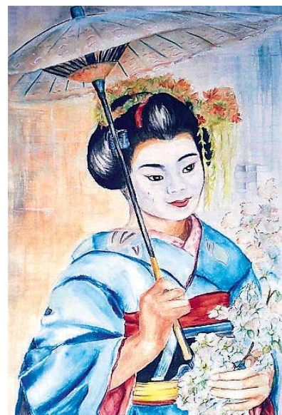
in aller Welt.